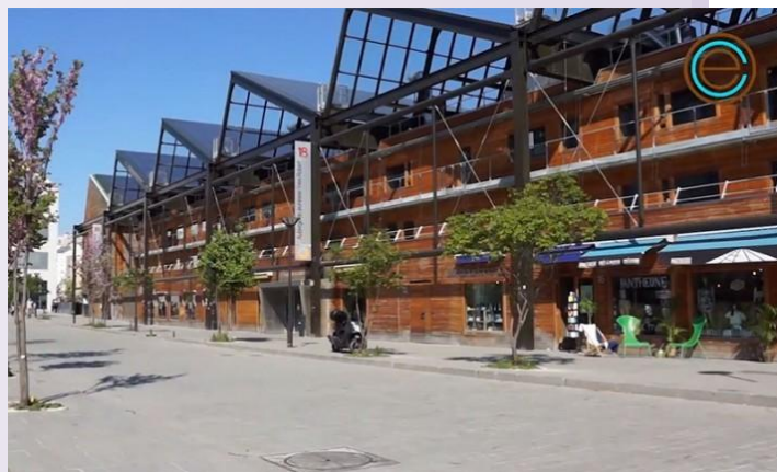
L'Auberge de jeunesse Yves Robert (Paris 18e) où se déroulera le congrès

Sur ces points et bien d'autres, la réflexion et la contribution d'un maximum de retraités sont souhaitables et indispensables pour que nous définissions collectivement au mieux nos attentes. Alors, retraités adhérents de l'UNSA, pas d'hésitation : soyez nombreux et participez activement au congrès de votre département.